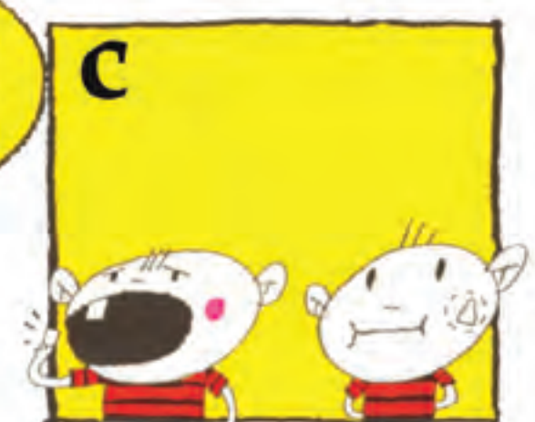
c Esnerik ez baduzu, sar ezazu hortza ahoan, masailaren eta oien artean