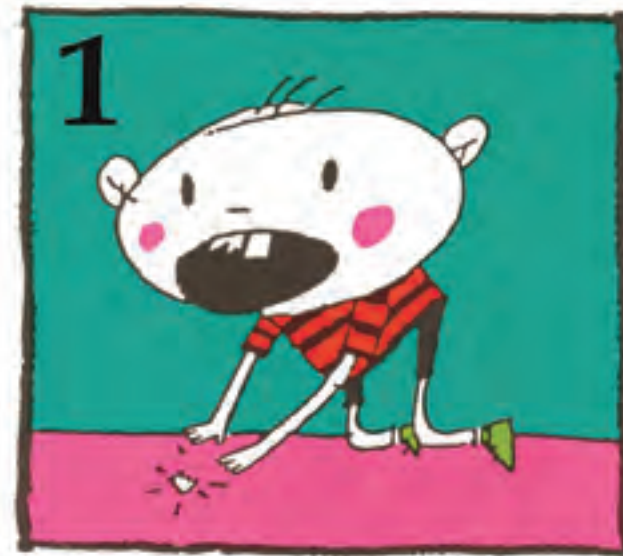
1 Bila ezazu hortz zattia