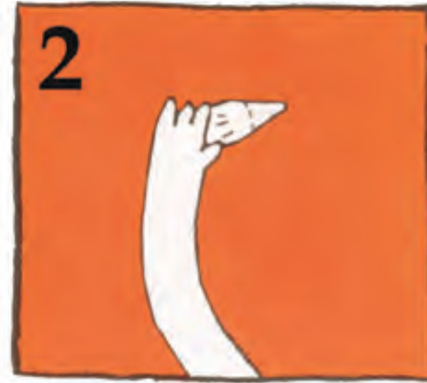
2 Heldu hortzari koroatik