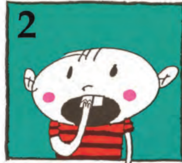
2 Hortz zattia berriro itsatsi daiteke