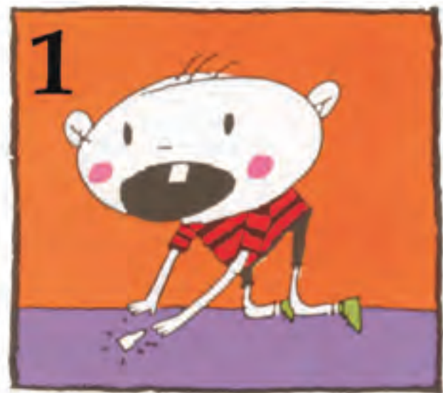
1 Bila ezazu hortz zattia