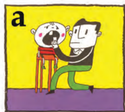
a Jar ezazu hortza berriro bere tokian