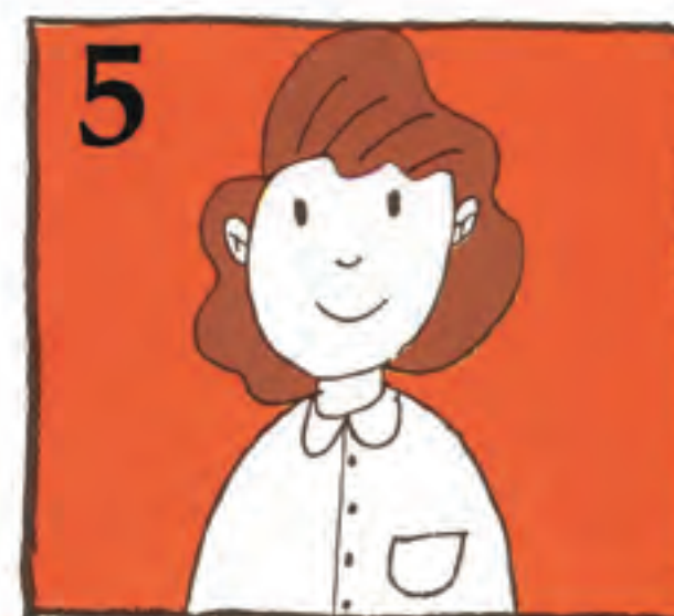
5 Bila ezazu sendabide espezializatua bi ordu igaro baino lehen