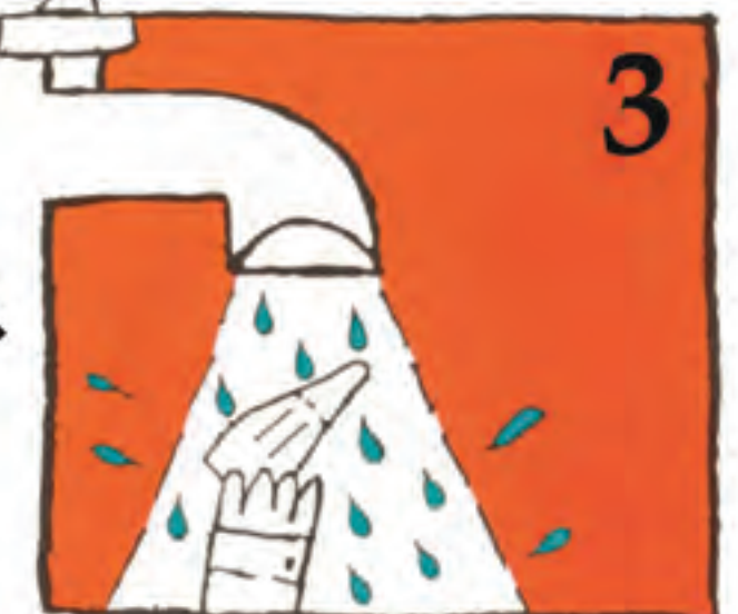
3 Garbi ezazu iturriko ur hotzetan