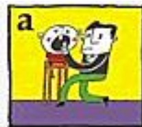
a Plaats de tand terug in zijn holte