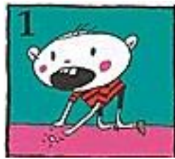
1 Zoek het stukje tand