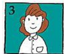
3 Ga hiervoor onmiddellijk naar een tandarts