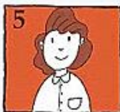
5 Ga dadelijk naar een gespecialiseerde tandarts, binnen de 2 uur