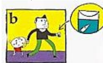
b Bewaar de tand in melk (of fysiologisch serum)