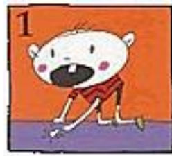
1 Zoek je tand