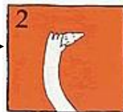
2 Neem hem bij de kroon vast