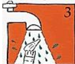
3 Spoel hem onder koud water (plaats de stop eerst in de afvoer!)