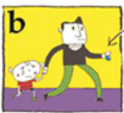
دندان را در یک لیوان شیر بگذارید