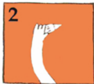
از قسمت تاج، دندان را نگه دارید