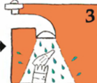
(در پوش راه آب را بگذارید) دندان را زیر آب سرد شیر بشویید