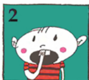
آن تکه می تواند چسبانده شود