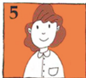
سریعاً به دندانپزشک متخصص مراجعه کنید (طی دو ساعت)