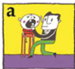
دندان را سر جای خود برگردانید