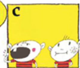
اگر شیردر دسترس نیست دندان را در دهان بین گونه و لثه بگذارید