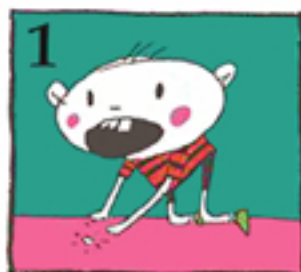
تکه شکسته دندان را پیدا کنید