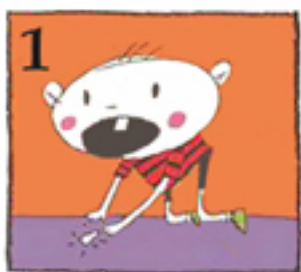
دندان را پیدا کنید