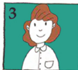
برای این کار سریعاً به دنبال دندانپزشک باشید